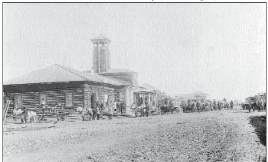
Выезд пожарной дружины г. Якутска

Со второй половины XIX ст. значительно улучшается пожарное дело в Якутске и увеличиваются средства на его со-