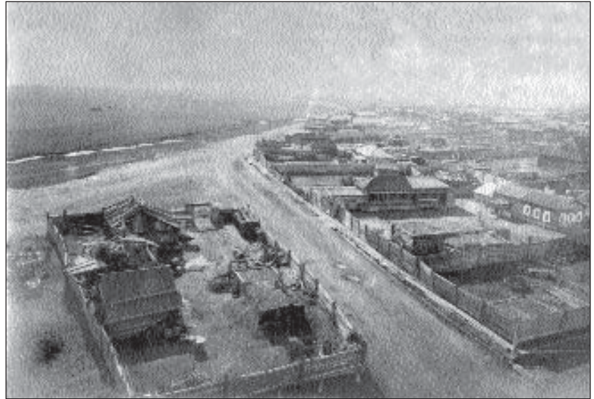
Панорама юго-восточной части города

Действительно, Якутский монастырь в XVIII ст. имел обширные хлебопахотные мес-