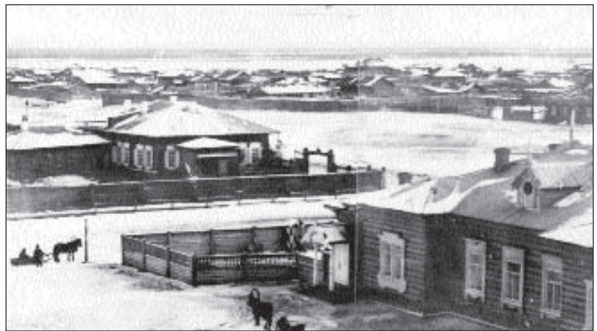
Деревянный Якутск. Справа на первом плане дом губернатора. На втором плане подворье Ф.Астраханцева. Затем озеро Теплое и заложная часть города

та по западной стороне загородных строений 2 .