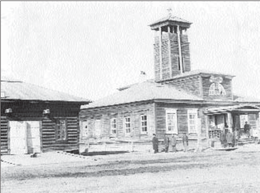
Якутское городское полицейское управление и пожарная каланча

Яковлевича Каргопольцева, начальника областного правления, в 1846 г. на 200 руб. был произведён ремонт пожарных инструментов и приобретены новые приспособления. Например, 12 багров ручных с железными черенками, 2 паруса из 400 аршин нового холста, 4 гунта ручных с деревянными «пялами», обтянутыми «коровым с шерстью войлоком» и обшитыми холстом, 14 топоров на длинных топорищах, 6 крючьев из нового железа, 8 пудов разных веревок 30 .