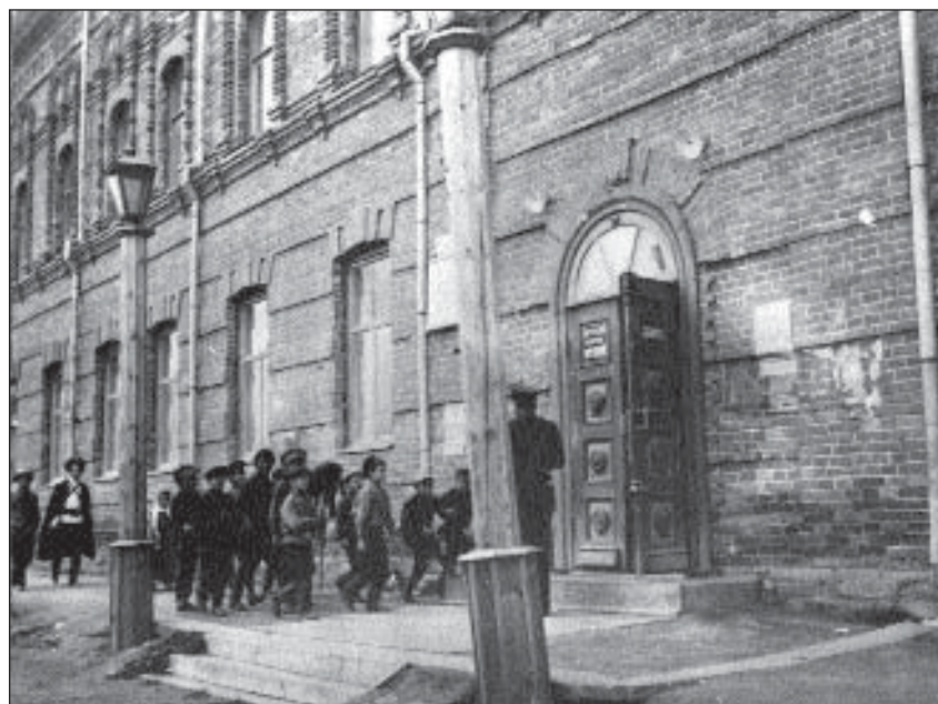
Здание библиотеки и музея, построенное в 1911 г. По обеим сторонам крыльца установлены фонари, вероятно, керосино-калильные

Добывающая и обрабатывающая промышленность дореволюционного Якутска была незначительной. Всё это производство, несомненно, было