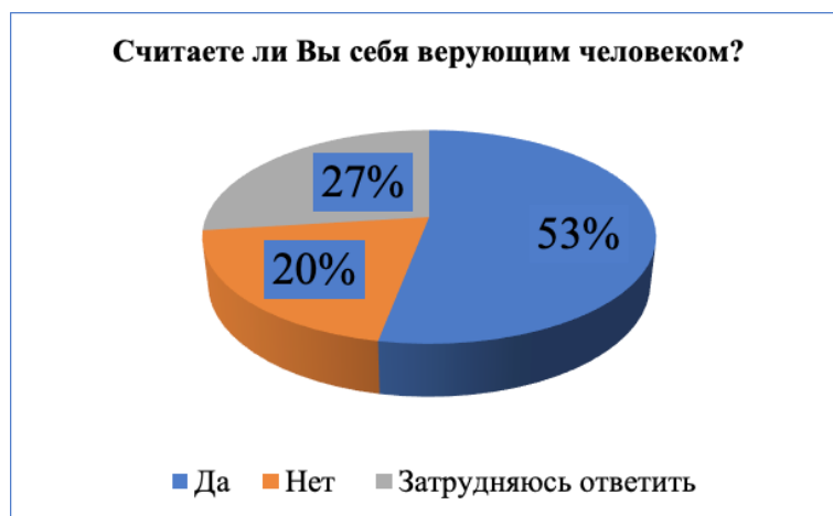
Рис. 1. Распределение ответов на вопрос «Считаете ли вы себя верующим?» (в%)

труднились ответить 11% респондентов. Необходимо отметить, что небольшая часть респондентов якутской национальности выбирали одновременно православие и традиционные верования, для них, как и для якутов центральной Якутии характерен феномен двоеверия [1], для вилюйских эвенков это не свойственно.