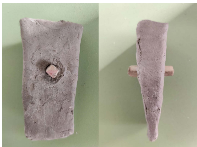
Рис. 5 Сердечник в форме для отливки