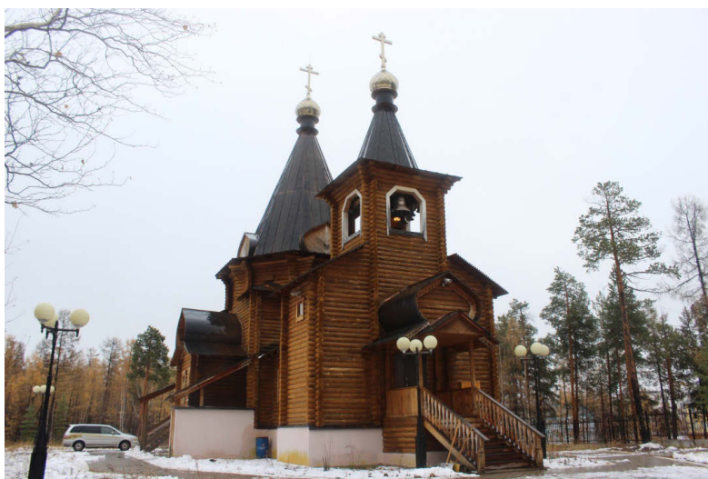
Рис. 2. Православный приход в честь Владимирской иконы Божьей матери п. Светлый Якутской епархии РПЦ (МП)

Соблюдают религиозные обряды 32,7% респондентов, делают это по праздникам также 32,7%, не считают это необходимым 31,6% опрошенных, остальные затруднились ответить. В возрастной категории «35-49», как среди женщин, так и среди мужчин преобладает ответ «по праздникам». Гражданам этой категории, в основном