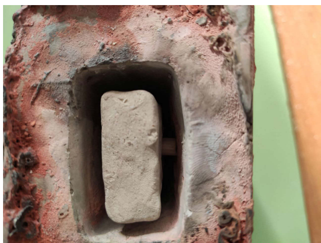
Рис. 4 Одноразовый сердечник для отливочной формы.

Эксперимент разделился на четыре этапа. Во-первых, отливка гипсовой копии мурьинского кельта, во-вторых создание формы для отливки бронзового изделия и в-третьих выплавка. Для отливки гипсовой копии были апробированы три материала. Это керамио-целлюлозная скульптурная масса, скульптурный пластилин с пониженной жирностью, но наиболее эффективной себя показала отливка формы из силикона. Марка силикона Эластолукс-М позволила отлить форму в мельчайших подробностях. Дополнительно был сделан слепок верхней части внутренней поверхности кельта. Для создания форм отливки из гипса с помощью силиконовой формы были изготовлены гипсовые и восковая копии кельта. Сердечник изготовлен из глиняно-песчаной, не обожженной массы. Упоры сердечника были изготовлены из глины, а также подготовлен вариант с деревянным упором, он кажется наиболее эффективным (рис. 4-5).