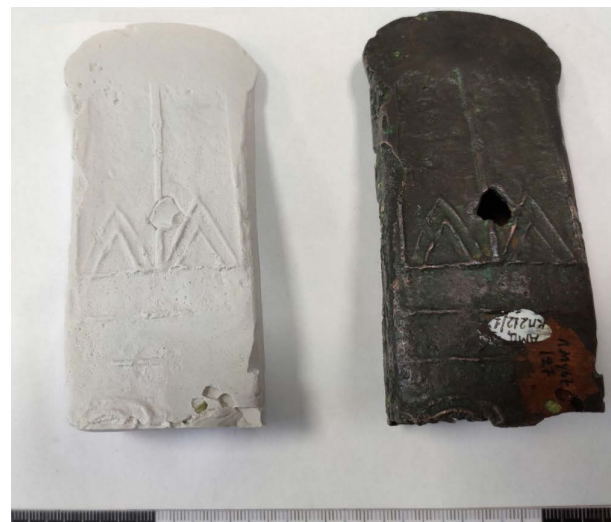
Рис. 3 Мурьинский кельт – вид сбоку

Эксперимент разделился на четыре этапа. Во-первых, отливка гипсовой копии мурьинского кельта, во-вторых создание формы для отливки бронзового изделия и в-третьих выплавка. Для отливки гипсовой копии были апробированы три материала. Это керамио-целлюлозная скульптурная масса, скульптурный пластилин с пониженной жирностью, но наиболее эффективной себя показала отливка формы из силикона. Марка силикона Эластолукс-М позволила отлить форму в мельчайших подробностях. Дополнительно был сделан слепок верхней части внутренней поверхности кельта. Для создания форм отливки из гипса с помощью силиконовой формы были изготовлены гипсовые и восковая копии кельта. Сердечник изготовлен из глиняно-песчаной, не обожженной массы. Упоры сердечника были изготовлены из глины, а также подготовлен вариант с деревянным упором, он кажется наиболее эффективным (рис. 4-5).