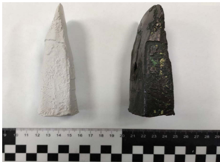
Рис. 2 Мурьинский кельт – вид сбоку

многоцветная форма. Сердечник по классификации Ненахова второго типа [2, с. 49] изготавливался из смеси глины и песка и был одноразовым, о чем свидетельствует шероховатая поверхность втулки кельта, повторяющая поверхность глиняно-песчаной смеси. Сама втулка относится к первой группе и первому типу по классификации Ненахова [6, с. 114]. Обух кельта признается обломанным, однако вполне вероятно имел место быть – обыкновенный недолив из-за отсутствия материала (рис. 3).