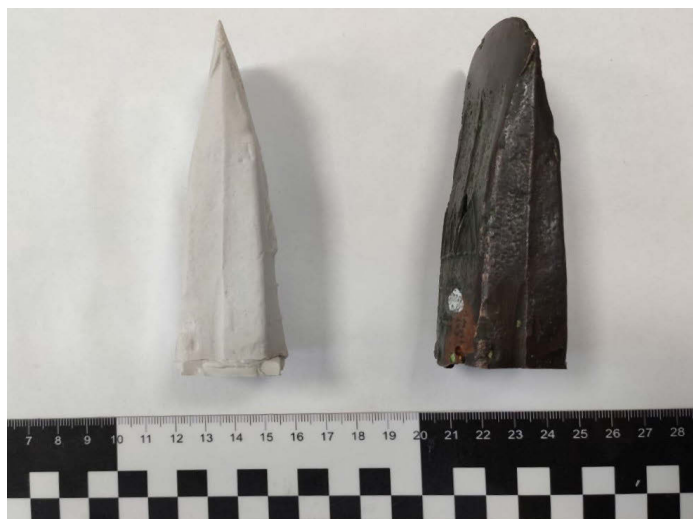
Рис. 1 Мурьинский кельт – вид сбоку

Таким образом, визуальный осмотр мурьинского кельта дает следующую информацию. Лезвие деформировано в бок, а не сточено. Об этом говорят сохранившаяся линия орнамента со стороны деформации, которая изгибается вместе с кельтом и не теряет своей толщины, вертикальный изгиб прямого узора с другой стороны и изгибы отливочных швов (рис. 1).