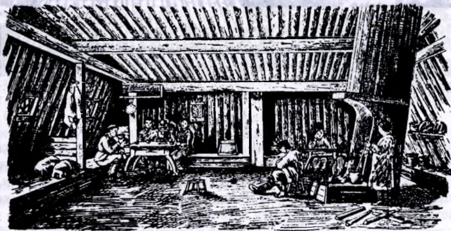
Внутренность якутской юрты

Как жильё якутская юрта вместе с хотоном представляют собой крайне нездоровую и неблагоприятную обстановку. Соседство с хотоном, который содержится очень неопрятно, отражается на воздухе всего помещения. В юрте чувствуется много аммиака и всяких других летучих органических соединений — продуктов разложения. Почва в юртах гнилая, оплеванная, изгаженная. Все это создает крайне тяжелую обстановку и исследователи не жалеют красок, чтобы описать всю неприглядность юрты. В санитарно-гигиеническом отношении юрта является далеко не благополучной, она является источником многих заболеваний. Маленькие окна с обломками стекол, а зимою куски льда вместо стекол дают очень мало света и в юрте всегдашний полумрак. Ярко пылающий камелек засушивает воздух и палит лицо. В этом смысле он действует и на роговицу глаз. Температура в юрте крайне неравномерна: жара, когда пылает камин, и настоящая стужа к утру... вот обычная температура зимой. Сквозняки в стенах, косяках и дверях — обычное явление. Ввиду этого у якутов обычны мышечный и суставной ревматизм, легочные заболевания простудного происхождения. Камелек за зиму пожирает невероятное количество дров. За зиму на камелек расходуется от 40 до 50 погонных саж. дров, т. е. 120—150 возов. Сколько же за целый год!