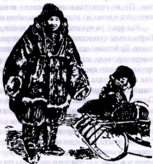
Чукчанка (Колымский округ)