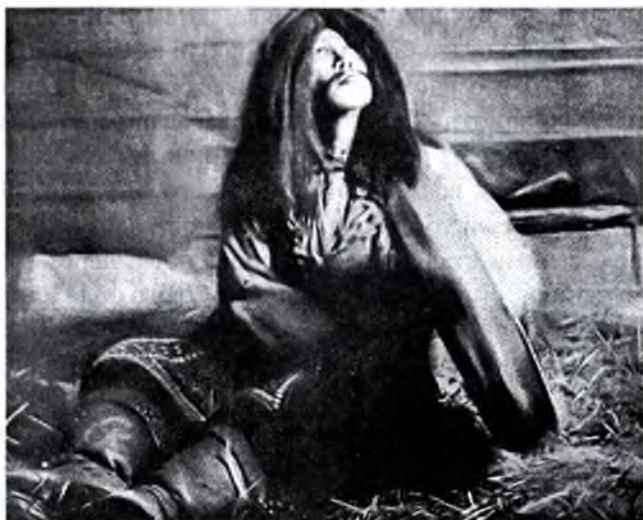
Шаман в экстазе

из своего лучшего, дорогого, священного, каким, несомненно, для них является лошадь. В якутских лесах до сих пор можно встретить развешенные на деревьях конские головы – черепа. Объясняется это тем, что, когда пропадает или убивается лошадь, части ее тела, для большего уважения, не выбрасываются, а сохраняются вышеупомянутым способом, чтобы их не могли топтать или попирать ногами. Также якуты почитают лебедя и не употребляют его мясо в пищу, объясняя, что он некогда являлся их предком, будучи до превращения в птицу женой Аи Тоёна (верховного су-