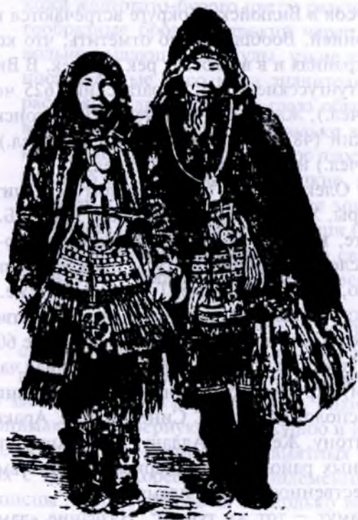
Ламуты (Колымский округ)

Жилищами тунгусам служат урасы (ураса-шалаш)*. Последний представляет собой конус с диаметром основания около 7 арш. и высотой 4 1 / 2 аршина. Остов урасы делается из очищенных от коры жердей. Для установки последних на расчищенном месте ставят две основные жерди – «салхамча», соединяющиеся наверху под углом; скреплением служат сучья на верхушке жердей, обращенные в разные стороны. Весь остов урасы обычно состоит из 40 жердей. Остов покрывается берестой или покупной материей (нанка, миткаль, кретон, реже холст, сукно). Обыкновенно нижняя часть урасы, под которой расположены постели, укрывается более прочным материалом, чтобы не промоchило дождем. Берестяные пластины для прочности при шитье