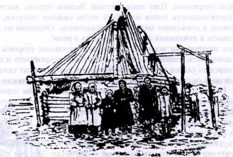
Якуты Колымского округа

встречаем в самом крайнем северо-восточном округе — Колымском. По р. Колыме якутские поселения идут немного южнее В.-Колымска, на севере же поднимаются по рр. Колыме и Алазее почти до границ лесов. Большая часть якутского населения расположилась на западном от р. Колымы плоскогорье.