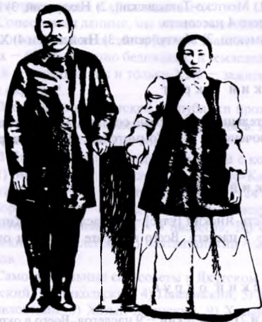
Якуты в обычных своих костюмах

(Расселение их. Образ жизни и обстановка, национальные верования)