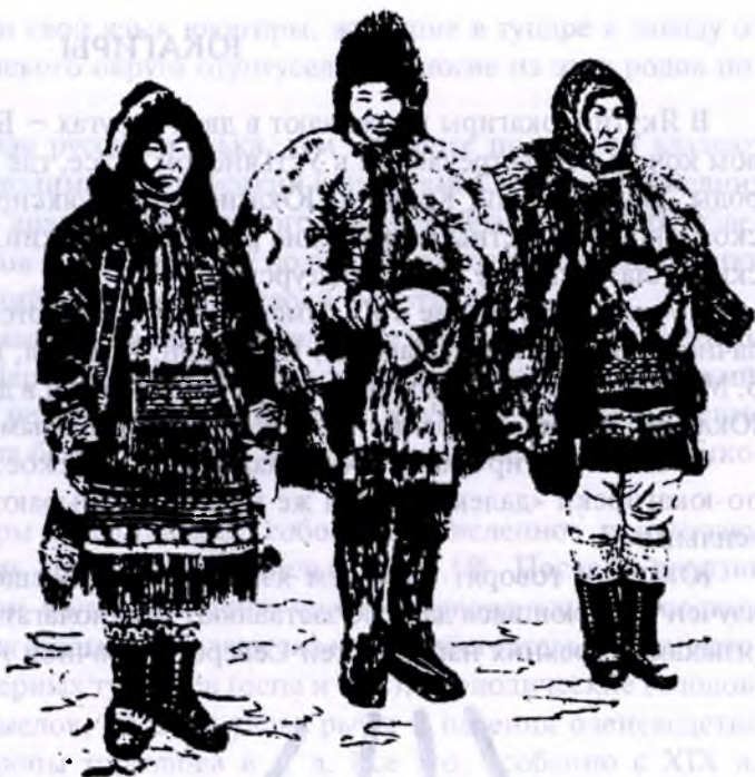
Кочующие ламуты (Устьянский улус)

В северных округах Якутии (Булунском и Колымском) проживают народности, которых наука относит к так называемым палеоазиатам, или древнеазийцам, потомкам древних обитателей Азии. Из палеоазиатов Якутской республики известны юкагиры и чукчи, которые проживают на нашем северо-востоке.