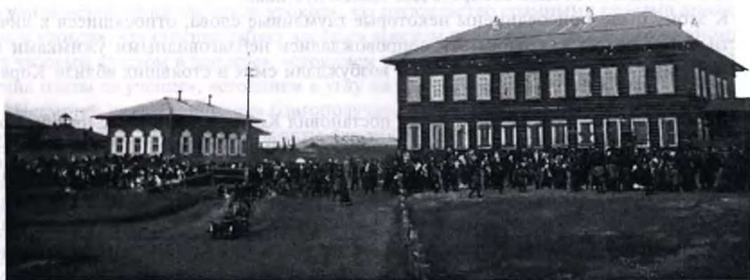
Реальное училище по ул. Логовая, ныне ул. им. А. Кулаковского. Здание сохранилось, принадлежит Якутскому Государственному университету им. М. К. Аммосова

ственной, красивые явления природы, то рассеянность пишущих и читающих возраст до болезненного состояния... выражаю сожаление, что Педагогический Совет на издание учениками Прогимназии не взглянул с педагогической точки зрения; покорно прошу Вас, Милостивый Государь, не только прекратить составление его, но и наобласти, чтоб не было тайного продолжения журнала». Иркутск, по-видимому, не особенно доверял Педагогическому Совету Якутской прогимназии, да и обстановка в Якутской области в то время, пожалуй, была такая, что нужно было особенно следить за настроением далекой окраины, так как для «заразы и вредного образа мыслей» было достаточно данных. Ввиду этого главный инспектор «для ознакомления с образом мыслей и направлением воспитанников» просит доставить ему составленный ими журнал 1 .