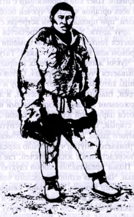
Чукча-оленеvod (Колымский округ)

В 80-х гг. XIX в. их было много в западной (от р. Колымы) тундре, но чрезвычайно неблагоприятные условия жизни (обеднение, эпидемии) значительно сократили чукчей к западу от Колымы и они поспешили переселиться к востоку. Таким образом, теперь в западной части бродит незначительное количество чукчей. По роду занятий чукчи делятся: 1) на сидячих (анакален), живущих селениями по всему побережью Ледовитого океана от Шелагского мыса до Чукотского носа, отчасти от носа до Анадырской губы; 2) оленных (чавча), бродящих по Берингову полуострову, в бассейне рр. Анадыря (по левому берегу), Чауны и Колымы (в нижнем течении); оленные чукчи встречаются и в Большой тундре между Колымой и Индигиркой; и 3) торговых чукчей, или носовых (кавраремкит). Последние живут вблизи м. Дежнева и занимаются торговлей с американцами и своими сородичами 2 . Чукчи — бродячий народ, они все время передвигаются с места на место. Осенью со своими стадами (оленьями) держатся опушек леса, укрываясь от бурь, а весной и летом перегоняют стада к самому морю, чтобы избавиться от комаров и мошек; с той же целью многие группы чукчей поднимаются на ближайшие горные высоты, где снег держится в течение всего лета.