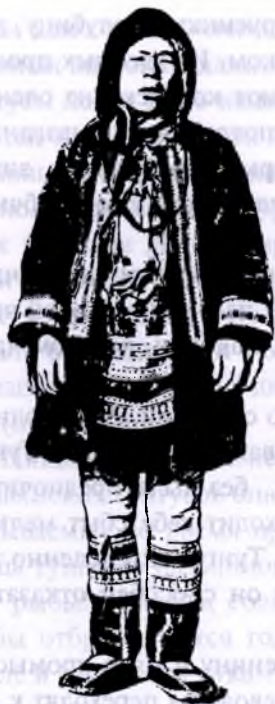
Ламут-зверолов (Устьянский улус)

Оленеводство, сокращаясь ежегодно, тем не менее играет и теперь большую роль, доставляя все необходимое тунгусу. По довоенным сведениям, в Аяно-Нельканском районе насчитывалось только несколько семейств, которые имели у себя самое большое — 250 оленей 1 . Большинство же тунгусов бедны оленями. Убыль в этом районе объясняется развившимися заболеваниями, а также гибелью от волков и медведей.