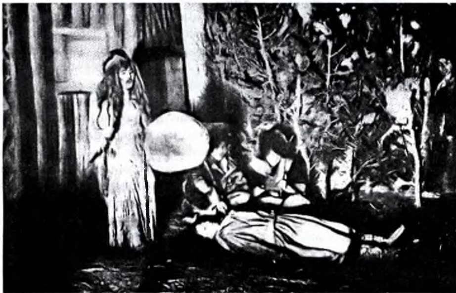
Шаман над больным

косновением с воздухом. У якутов существует поверье, что «кут» представляет собой маленький черный уголек или камешек, который шаман находит иногда в избе с левой стороны под землей и который, положенный на ладони шамана, шевелится. Но кроме «кут», которая есть комплекс физиологических отправлений, [человек] имеет еще «сур» для психических [отправлений]; она, по верованию якутов, проникает в женщину через темя в момент зачатия; «сур» имеет отношение к голове, а «кут» связана с челюстями. Их судьба в загробной жизни различна: «кут» съедобна для абасылар'ов, а «сур» — нет.