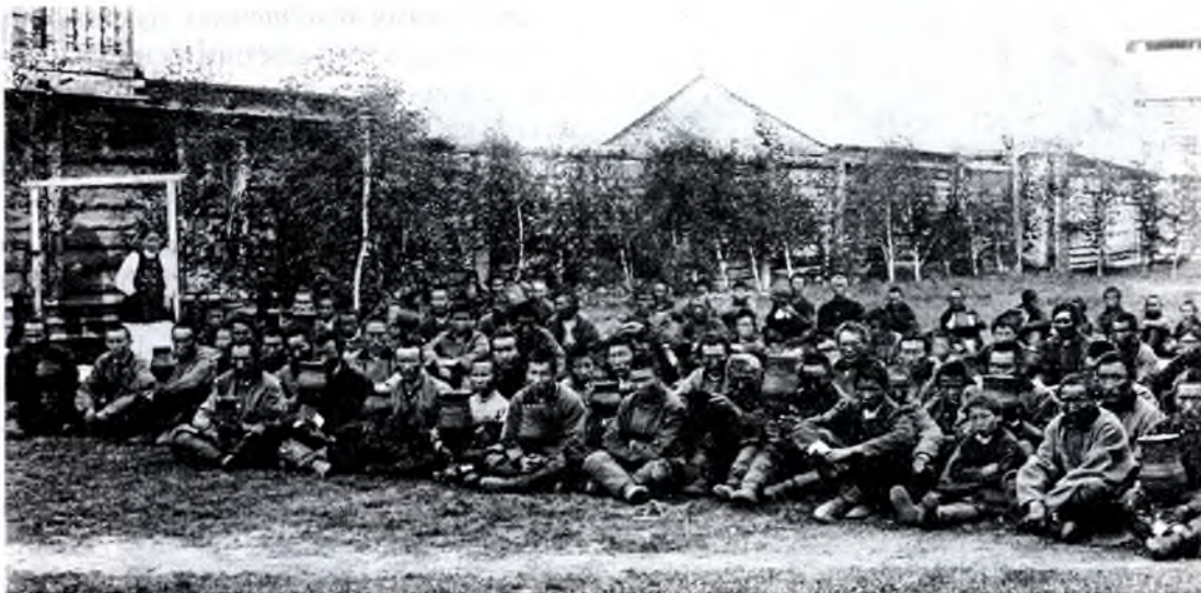
Пиршество якутов в старину («ысэх» — праздник кумыса)

После счастливых родов женщины бросают в огонь обыкновенно кусок масла или же остатки водки, говоря: «Пусть и огонь пьет, а то обидится». В реку во время ледохода и разлива бросают пищу: кусок хлеба с солью — и стреляют из ружей по льду. Пищу бросают для того, чтобы «а́ба» — бабушка, т. е. река, удовольствовалась этим и не делала больших повреждений.