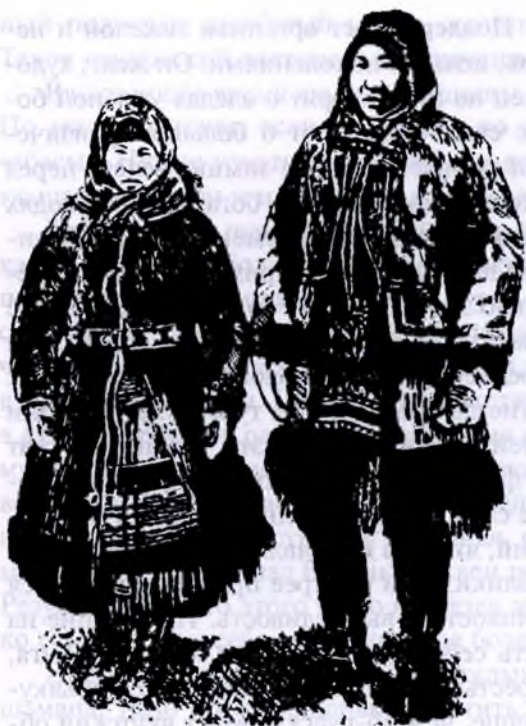
Тунгусы (Колымский округ)

Тунгусы имеют следующие физические особенности: средний рост с относительно большой головой, широкими плечами, несколько короткими конечностями и малыми руками и ногами; худощавое, мускулистое сложение, темные глаза, черные жесткие прямые волосы; кожа желтовато-бурого цвета; резкие дугообразные брови, широкий череп, довольно выдающиеся скулы, узкие глаза, поставленные косо и на значительном расстоянии друг от друга; глаза обыкновенно тусклы, разгораются только в минуты сильного раздражения; нос плоский, немного вздернутый, губы тонкие, подбородок круглый и характерные многоугольные, с маленькой мочкой уши (тунгусские). Общее выражение лица свидетельствует о добродушии, лени и беспечности характера 1 .