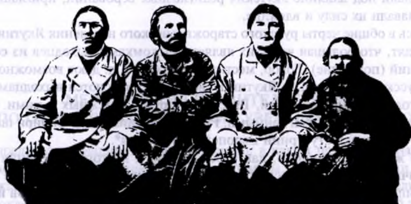
Скопцы (бывшие ссыльные в Якутскую область)

надлежит к бывшим ссыльным, купцам, казакам, вышедшим в свое время из своего сословия. Довольно любопытными являются бывшие верхоянские мещане, проживающие в с. Русское Устье в низовьях р. Индигирки, которых, по данным 1917 г., насчитывается около 200 человек обоего пола. Будучи едва ли не первыми пионерами на далекой Индигирке, русскоустыинцы, по словам наблюдателя, сохранили свой язык, обычаи и т. д. Даже больше, своему влиянию они подчинили окружающее население — ламутов, юкагиров и даже чукчей. По своему укладу жизни и духовной стороне они представляют собой живой осколок русских людей XVII в. В этом отношении они являются крайне любопытным этнографическим материалом, но, к сожалению, еще мало исследованным 1 . Несколько похожим на них является русское население на р. Колыме, главным образом местные казаки и мещане. Там составил особый колымский русский говор с оригинальными оборотами речи и особым произношением.