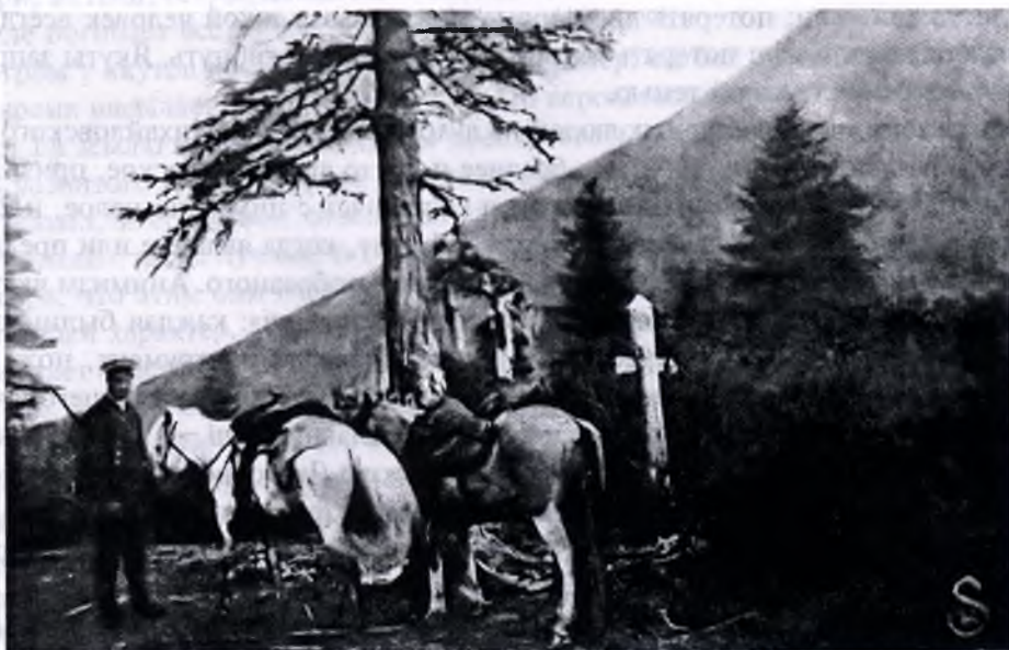
Дерево с жертвоприношениями горному духу (иччи)

деятель», вместо «абасы» [говорят] «ненасытный» и т. д. Нужно заметить, что на этом жаргоне якутские слова охотно заменяются русскими в надежде, что духи, которых намерены обмануть, не знают русского языка. Говорить на этом языке — значит говорить «оберегаючи» вещи. С такою же целью у якутов существует обычай в случае недолговечности детей обманывать смерть. Так, например, родители отдают своих детей на воспитание другим, дают ребенку название «ыт огото», т. е. собачье дитя, с целью, чтобы и смерть обманулась, сочтя дитя действительно за щенка. С другой стороны, с этой же целью собак нередко называют детскими именами. Переодевают девочку мальчиком и наоборот также с целью обмануть смерть.