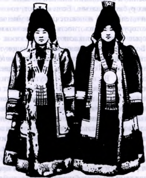
Якутки в зимнем национальном costume

Практичностью отличаются якутские шубы. Они просторны. Рукава на плечах имеют буфы со свободным пространством для скопления согретого над плечевыми