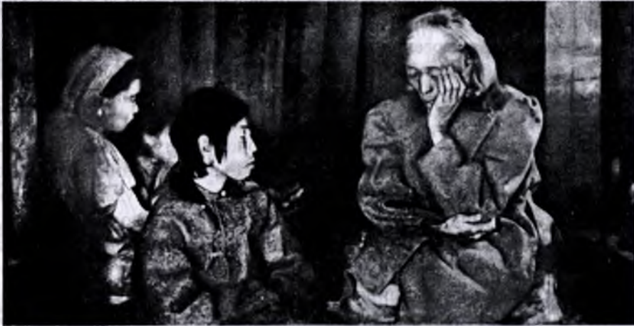
Якут рассказывает сказки

они в большинстве случаев теперь относятся как к «сказкам» и если исполняют обряды, то также бессознательно в силу унаследованных традиций. В длинные зимние вечера, когда на дворе трещит мороз, когда все живое прячется, ища тепла и уюта, в якутской юрте пред весело пылающим камином собирается все семейство. Слепой старик-«олонхосут» – сказочник 1 сидит в центре пред самым камином и, подперев щеку руками, однообразно и монотонно, прерывая изредка повествование гортанным пением, рассказывает «олонхо» (сказку). Все с затаенным дыханием слушают историю о людях, превращенных в зверей... о духах «иччи», которые окружают людей со всех сторон... Долго за полночь продолжают эти «олонхо». Дети под влиянием этих сказок пугливо озираются по сторонам и теснее жмутся друг к другу; им кажется, что вот из-за темного угла на них смотрит «иччи»... Когда засыпают, то, несомненно, витают в царстве сказочных рассказов.