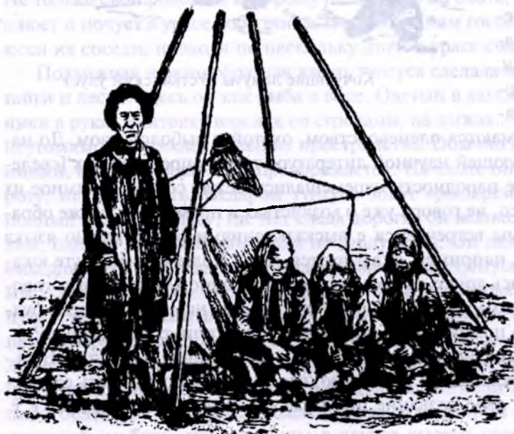
Юкагирская семья (верховья р. Колымы)

ных берегов Америки 3 . «Форма юкагирской речи отличается отсутствием длинных периодов. Она состоит из весьма коротких, отрывистых предложений, нередко неполных. То подлежащее, то другие части предложения отсутствуют и о них приходится догадываться по смыслу, по ходу рассказа, по предыдущему или последующему предложению» 4 . Юкагиры, которые говорят на своем языке, в настоящее время сохранились только на Верхней Колыме по рр. Коркодону, Шаудону и Ясачной. Анадырские юкагиры об-