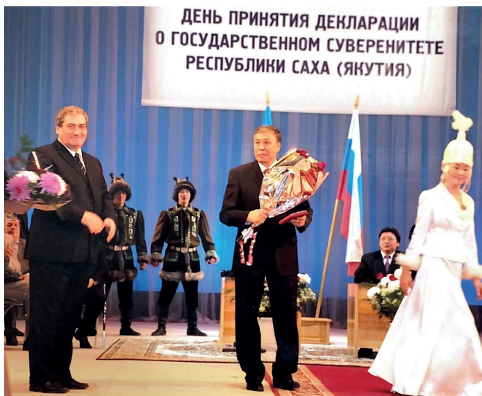
Вручение Ордена Почета. 2006 г.