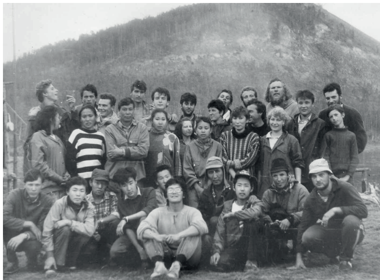
Со студентами-историками во время полевой археологической практики