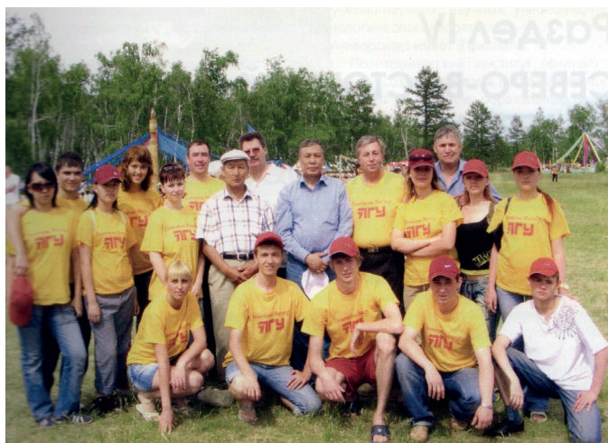
Преподаватели и студенты Нерюнгринского филиала на ысыахе ЯГУ. 2006 г.