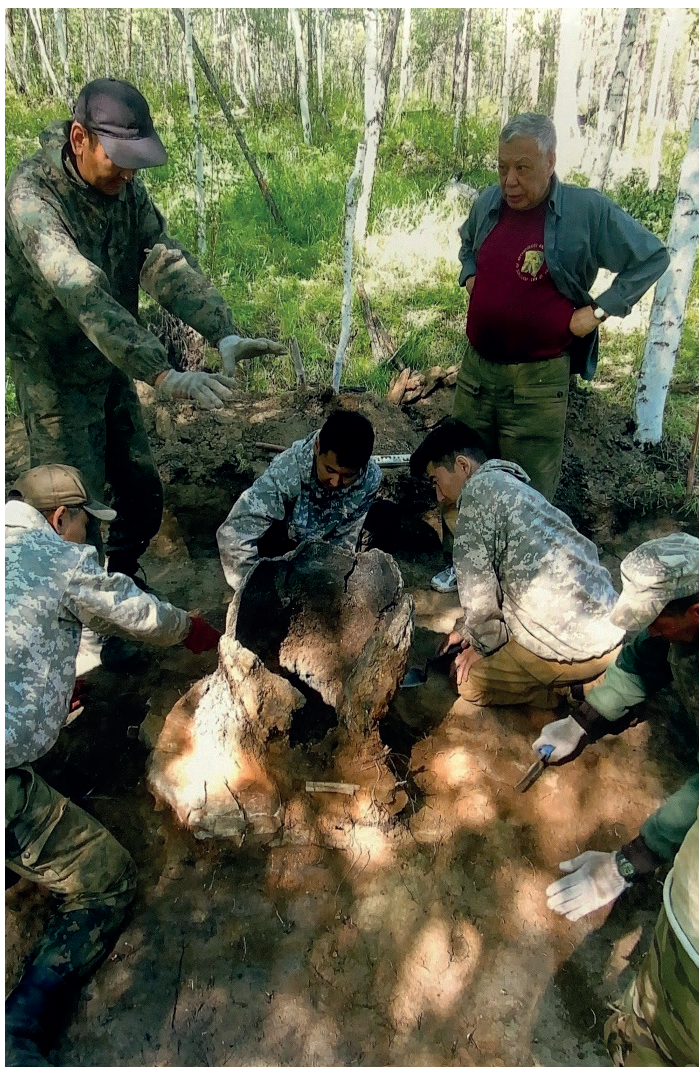
Раскопки древнего металлургического горна (Хангаласский улус, 2017 г.)