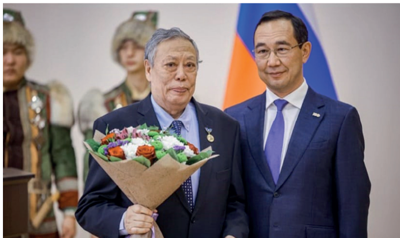
Вручение звания «Почетный гражданин Республики Саха (Якутия)». 2022 г.