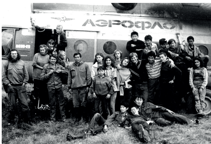
Завершение полевых работ (Токко, 1989 г.)