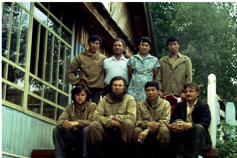
Друзья-археологи на даче