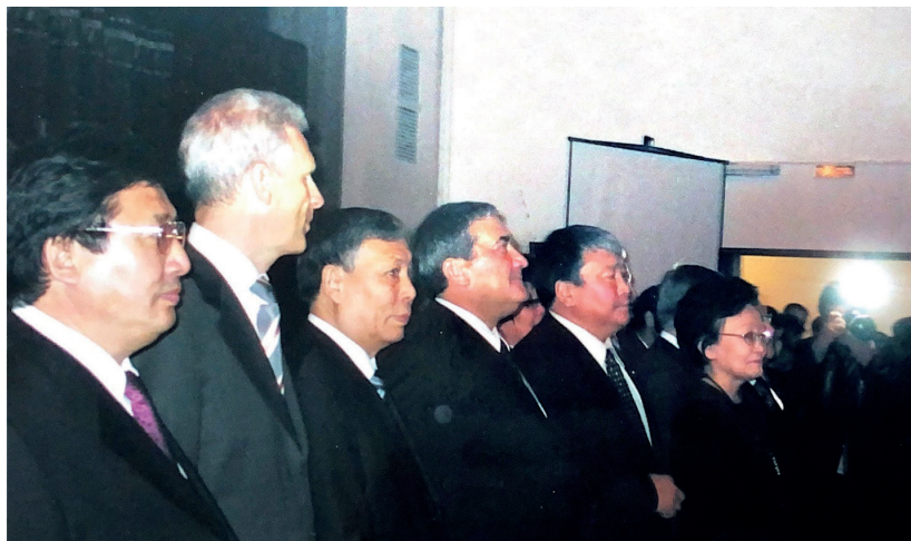
Визит министра образования и науки РФ А.А. Фурсенко