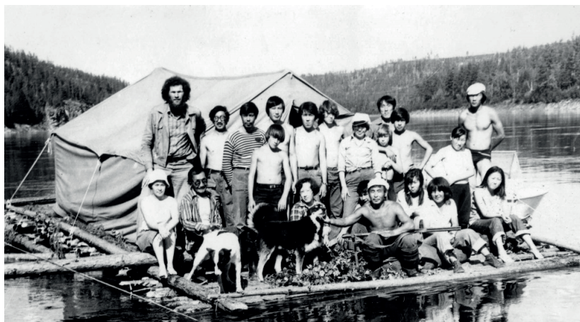
Сплав по р. Олекма (август 1975 г.)