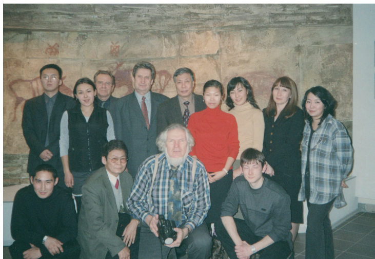
С академиком А.П. Деревянко после лекции у студентов-историков ЯГУ, специализирующихся по археологии и этнографии