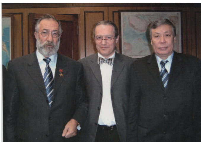
Почетный полярник России, депутат Государственной Думы А.Н. Чилингаров, ректор международного Университета Арктики Ларс Куллеруд, ректор ЯГУ А.Н. Алексеев