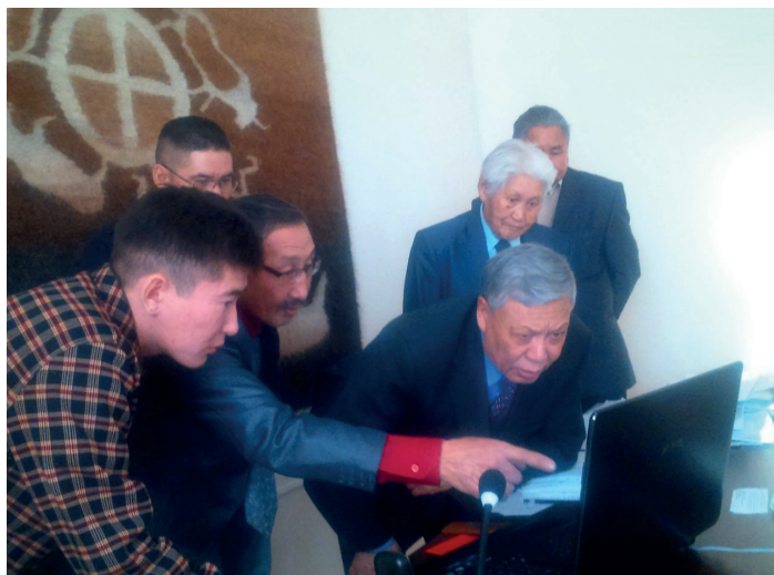
Обсуждение новых находок с коллегами и краеведами