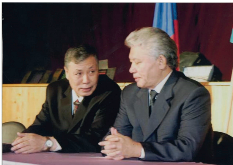
С Президентом Республики Саха (Якутия) М.Е. Николаевым