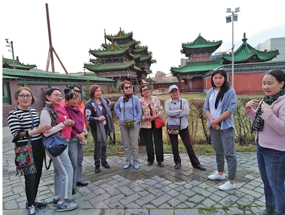
Участники III Международного пресс-тура из Якутии на экскурсии в музее, г. Улан-Батор. 2018 г.