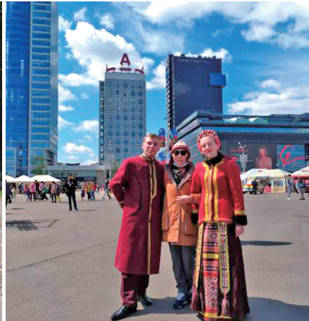
На Центральной площади столицы в перерыве праздничного концерта. 9 мая 2021 г., г. Минск, Республика Беларусь