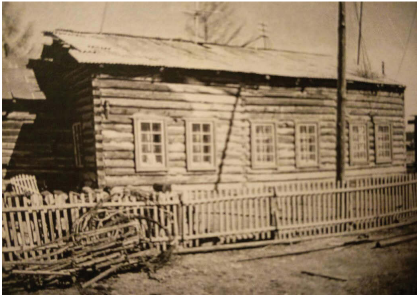
Дом П.А. Афанасьева в местности Эбэлээх

Аҕа дойдутун сэриитин кэмигэр Бөтүрүүсэ дьиэтигэр кэлиин нуучча дьонун дьиэ кэргэттэрин олохтооттара үһү. Ийэм, эдэр кыргыттар, дьахталлар мунньустан икки күнү быһа сууйбуттар-соппуттар, олохтоото бэлэмнээбиттэр. Сэриин кэнниттэн колхозтары бөдөнсүтүү кэмигэр 1951 с. «Үүнүү» (Остуйка), «Большевик» (Өнөр), «Кыһыл Сардаҥа» (Уһун Күөл) колхозтар «Ленин» аатынан колхоз буолтара.