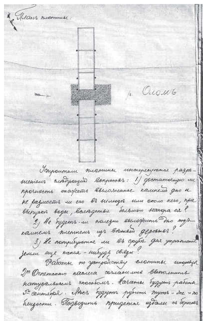
Рисунок 1. План плотины на реке Олом. НА РС (Я). Ф. 12. Оп.2. Д.5344. Л. 180б.