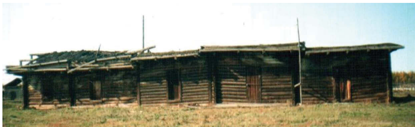
Усадьба Остуйка П.А. Афанасьева

каба турар 5 силлиһэ ампаардарын акылаатын уларытан, үрдүн бүрүөһүнүн сангардан, күрүөлээн, анал суруктаах бэлиэ ыйаан, исторической суолталаах былыргы хараан-нанар пааматынньыктар испиһэктэригэр киллэттэрэн, пааспардататыахха наада.