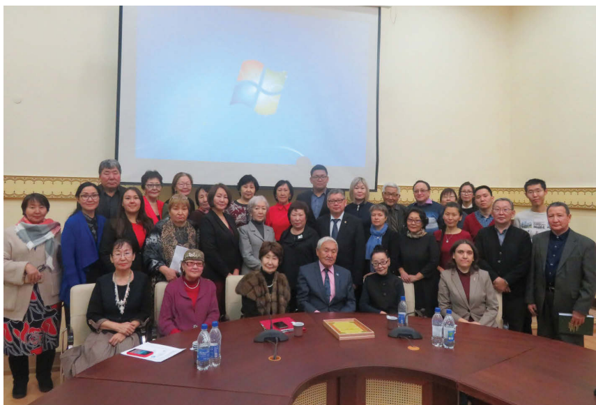
Участники республиканской научно-практической конференции «Якутия на рубеже XIX – XX вв.: общество, люди, память». 28 ноября 2019 г. ИГиИПМНС СО РАН, г. Якутск.