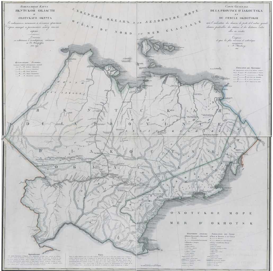
4. Генеральная карта Якутской области и Охотского округа. 1826 г.