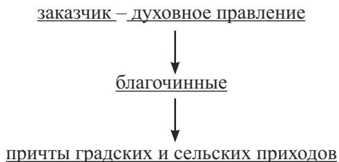
Рис. 3. Структура духовного управления Якутии

Очевидно, что отдаленность Якутии от центра епархии вызвала необходимость создания органа, координирующего и контролирующего деятельность духовного ведомства, и к концу XVIII в. действовал орган духовного управления. Структура духовного управления Якутии выглядела следующим образом (рис. 1):