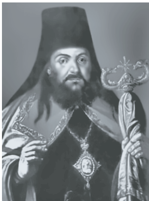
Рис. 4. Епископ Иннокентий (Нерунович)

хии 214 . Прибыв на служение в Иркутск и столкнувшись с трудностями, он энергично взялся за порученное ему дело, выявил ряд злоупотреблений как со стороны местного духовенства, так и светских властей. Нерунович предпринимал попытки реализации своей миссионерской программы, в том числе организации проповедей на языках народов Сибири, упорядочение льгот для принявших православие инородцев, выдачу «прогонных денег» (путевых расходов) для поездок миссионеров, обеспечение инородческих детей – учащихся школы, созданной по его инициативе при Иркутском Вознесенском монастыре, – одеждой и питанием. Но эти начинания остались не завершенными – как в связи с недостаточностью средств, так из-за отсутствия поддержки местной гражданской власти.