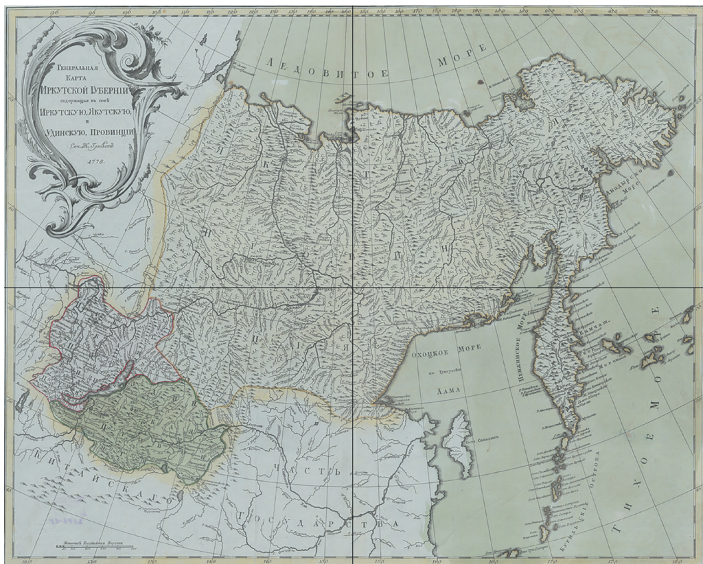
3. Генеральная карта Иркутской губернии, содержащей в себе Иркутскую, Якутскую и Удинскую провинции. Сост. Н. Трескот. 1776 г.