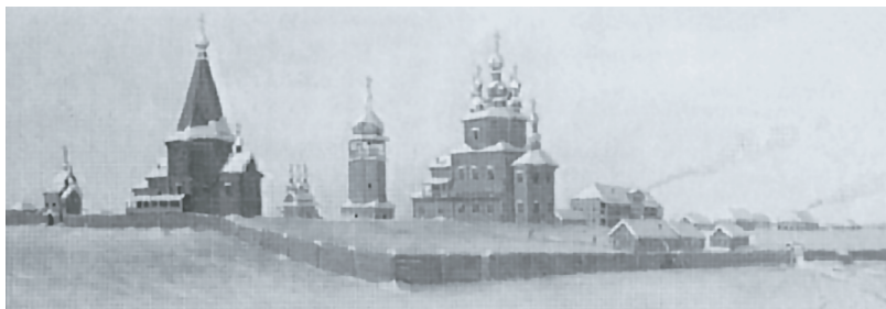
Рис. 1. Якутский Спасский монастырь. 1703 г. Художник П. Попов.

В XVIII в. по распоряжению тобольского владыки Антония (Стаховского) 181 в митрополии была проведена перепись храмов с целью определения границ территорий приходов. В 1725 г. в связи с неэффективностью было ликвидировано существовавшее ранее деление на десятины и были созданы церковно-административные округа (заказы), возглавляемые духовными (казачными) правлениями. Во главе правления находился заказчик – как правило, настоятель монастыря или соборного храма.