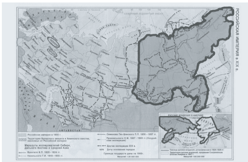
Рис. 2. Якутское благочиние в составе Иркутской епархии (1731–1856 гг.).