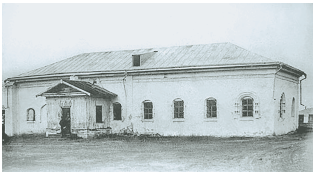
2. Здание Якутской воеводской канцелярии