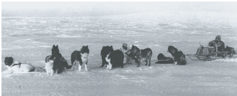
Рис. 5. Объезд священником своей паствы

делены в зависимости от территориальной близости храмов. Особенностью приходов Якутии являлась малочисленность населенных пунктов, связанная с образом жизни населения, отсутствие транспортной схемы и сезонная недоступность мест кочевания.