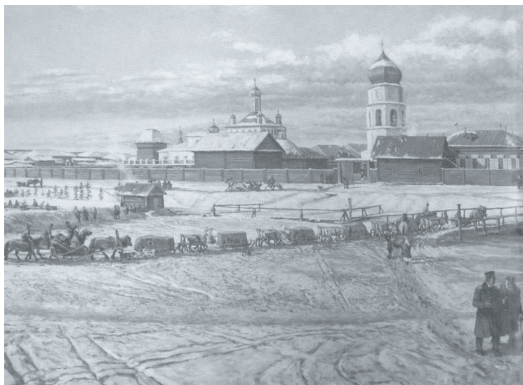
Рис. 6. Свято-Троицкий собор в г. Якутске

По сложившейся в Сибири традиции поселенец имел право выбора (какой храм посещать), но в Якутии это право было только у городских жителей, и в связи с достаточно поздним формированием сельских приходских общин населенные пункты и роды закреплялись за той или иной церковью.