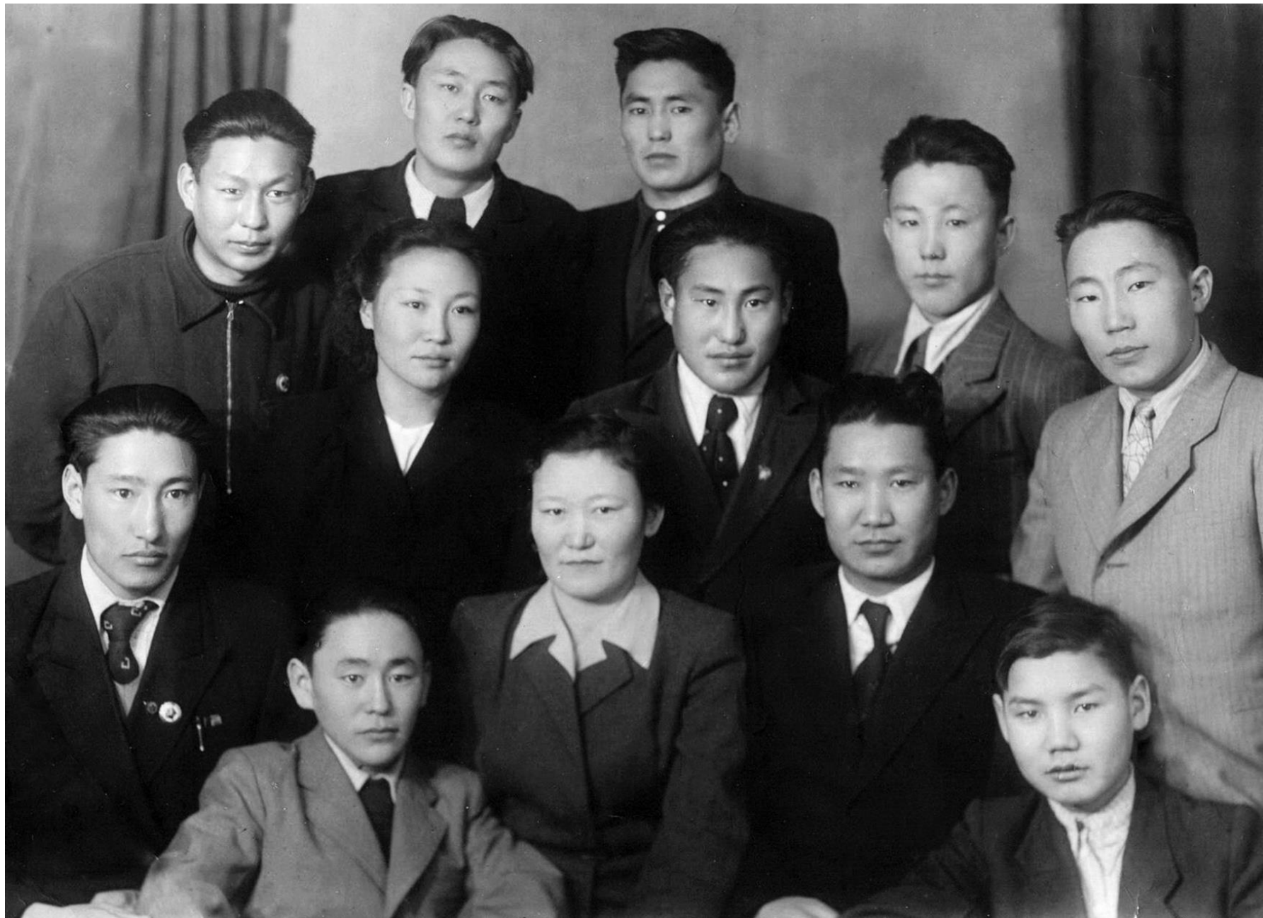
Молодежь Усть-Алданского района. 1940-е годы.