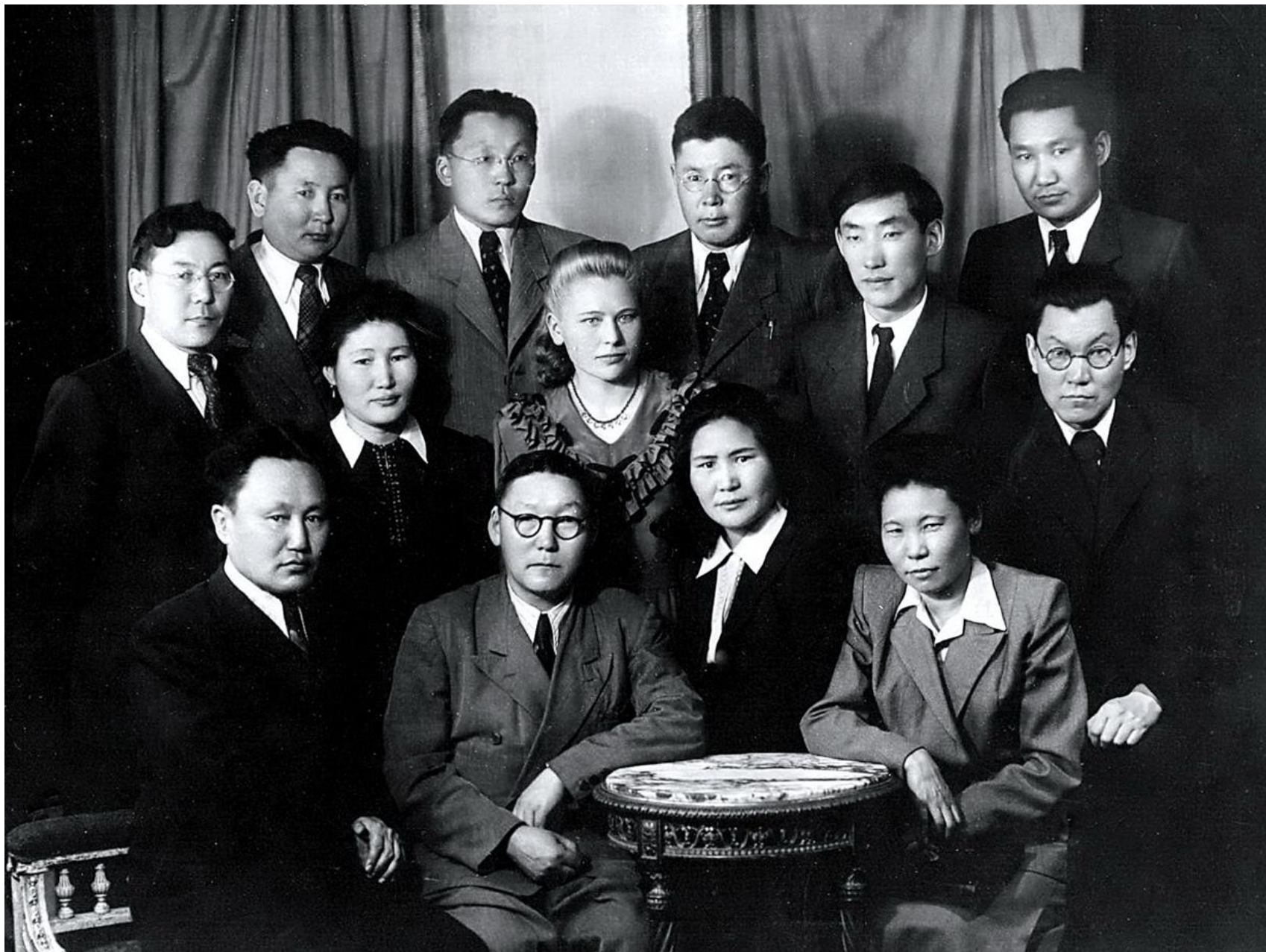
Встреча земляков. Москва. 1958 год.