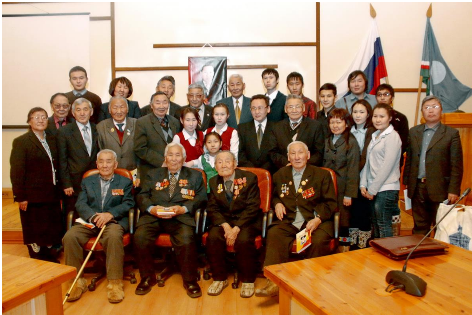
Конференция, посвященная 90-летию со дня рождения Д.Д.Петрова. 2011 год.