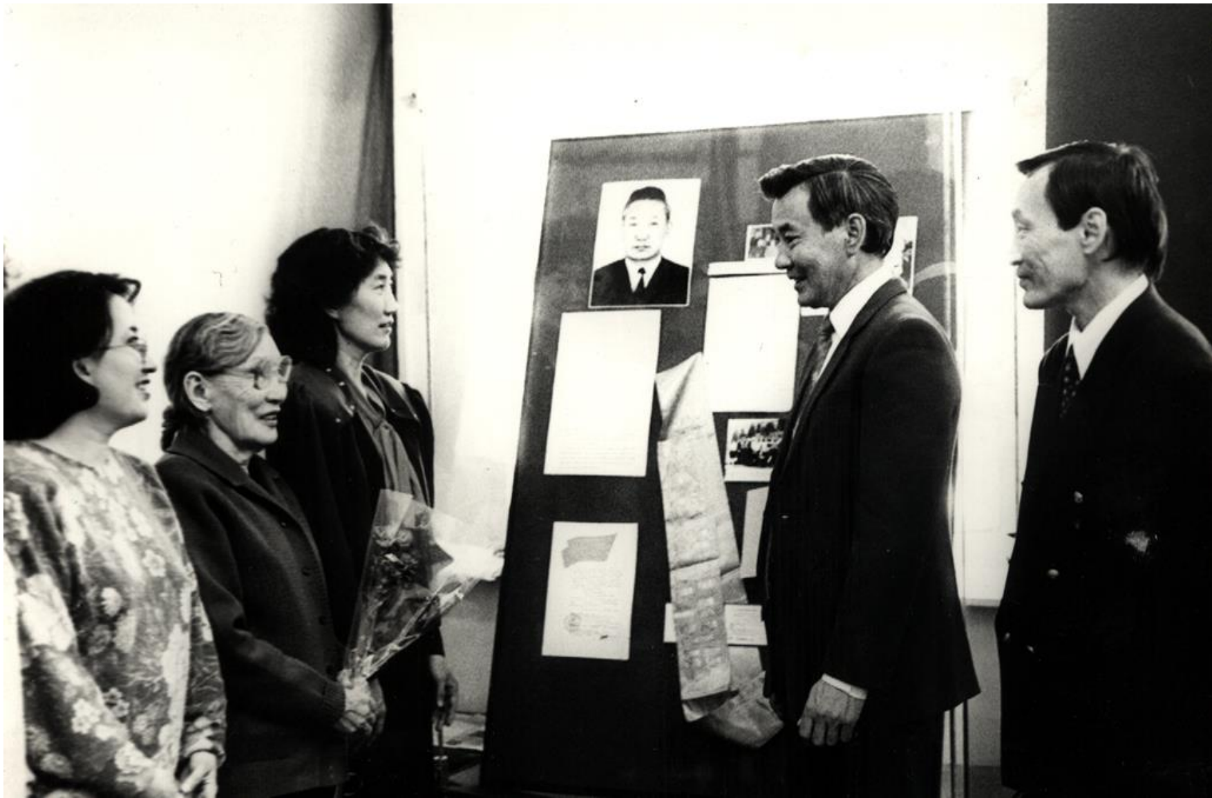
Супруга и дети на открытии выставки, посвященной Д.Д.Петрову.