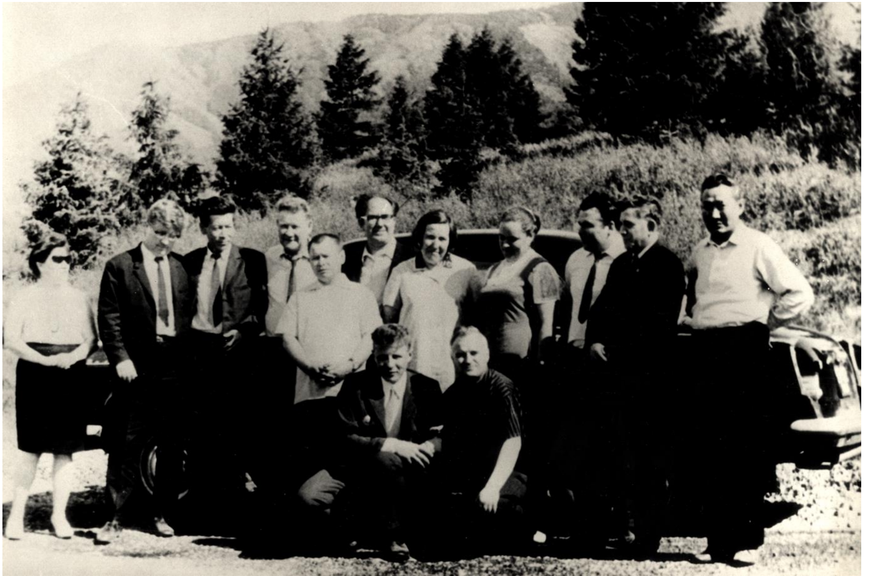
Участники международной научной конференции в Туве. 1978 год.