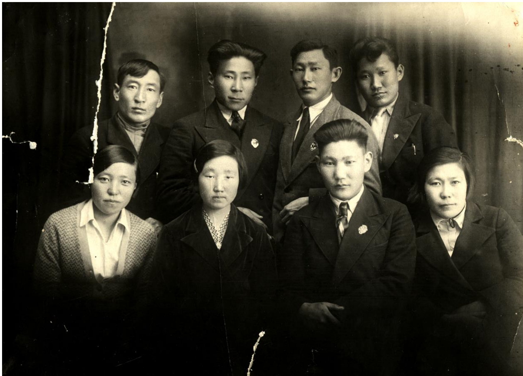
Члены РК ВЛКСМ Усть-Алданского района. 1940 г.