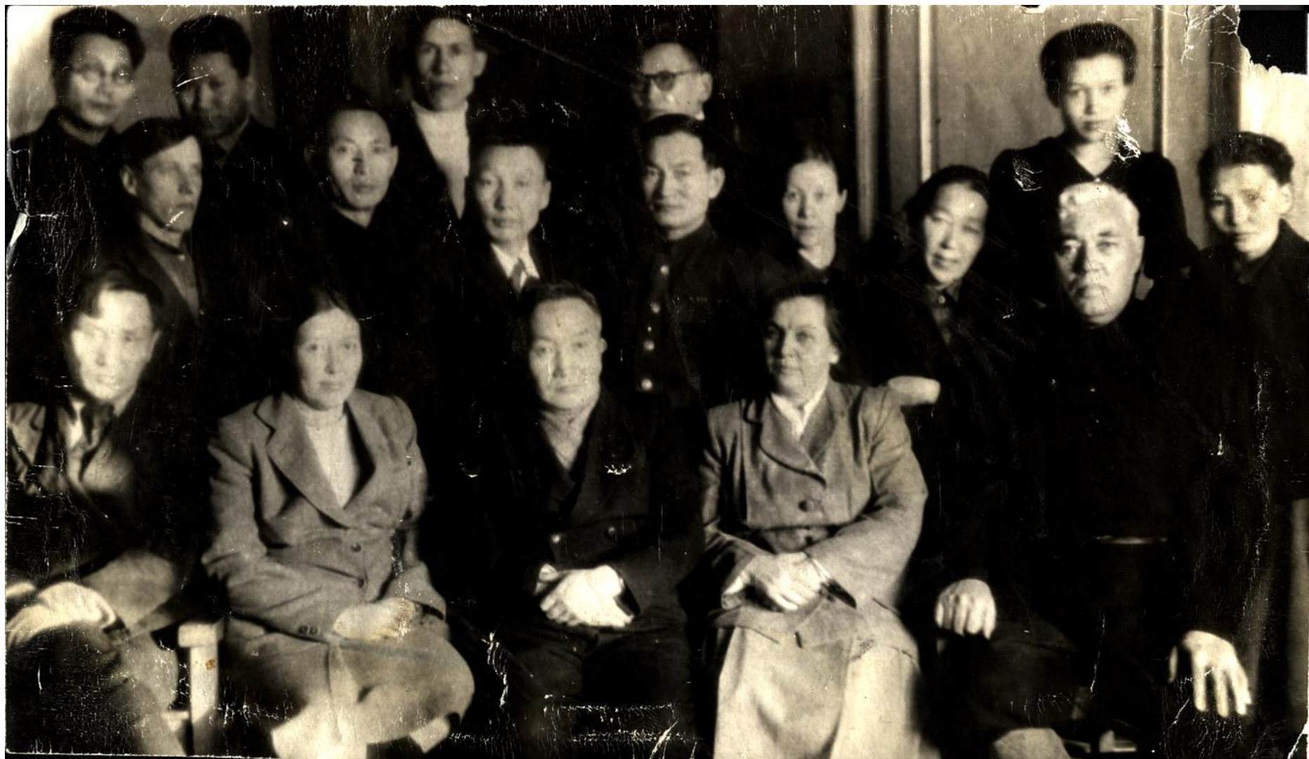
Научные сотрудники ИЯЛИ ЯФ АН СССР. 1950 год.