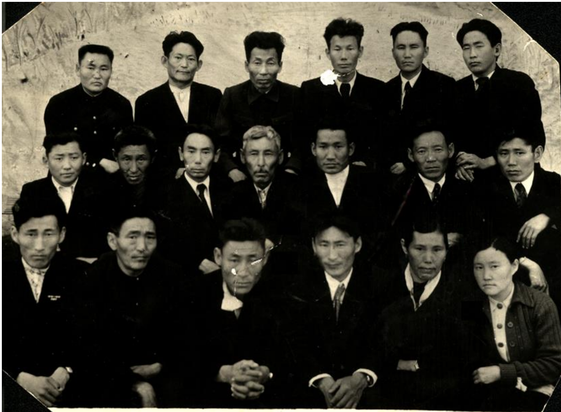
Педколлектив Мюрюнской средней школы. 1947.