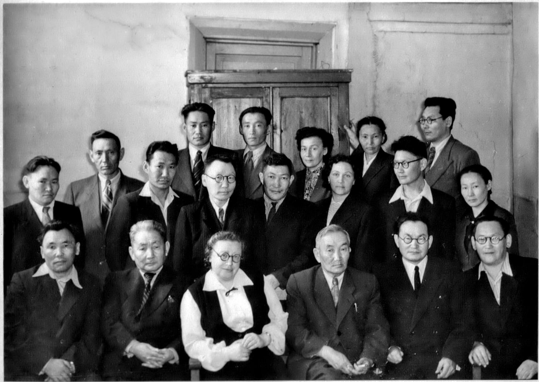
Научные сотрудники ИЯЛИ ЯФ АН СССР. 1957 год.