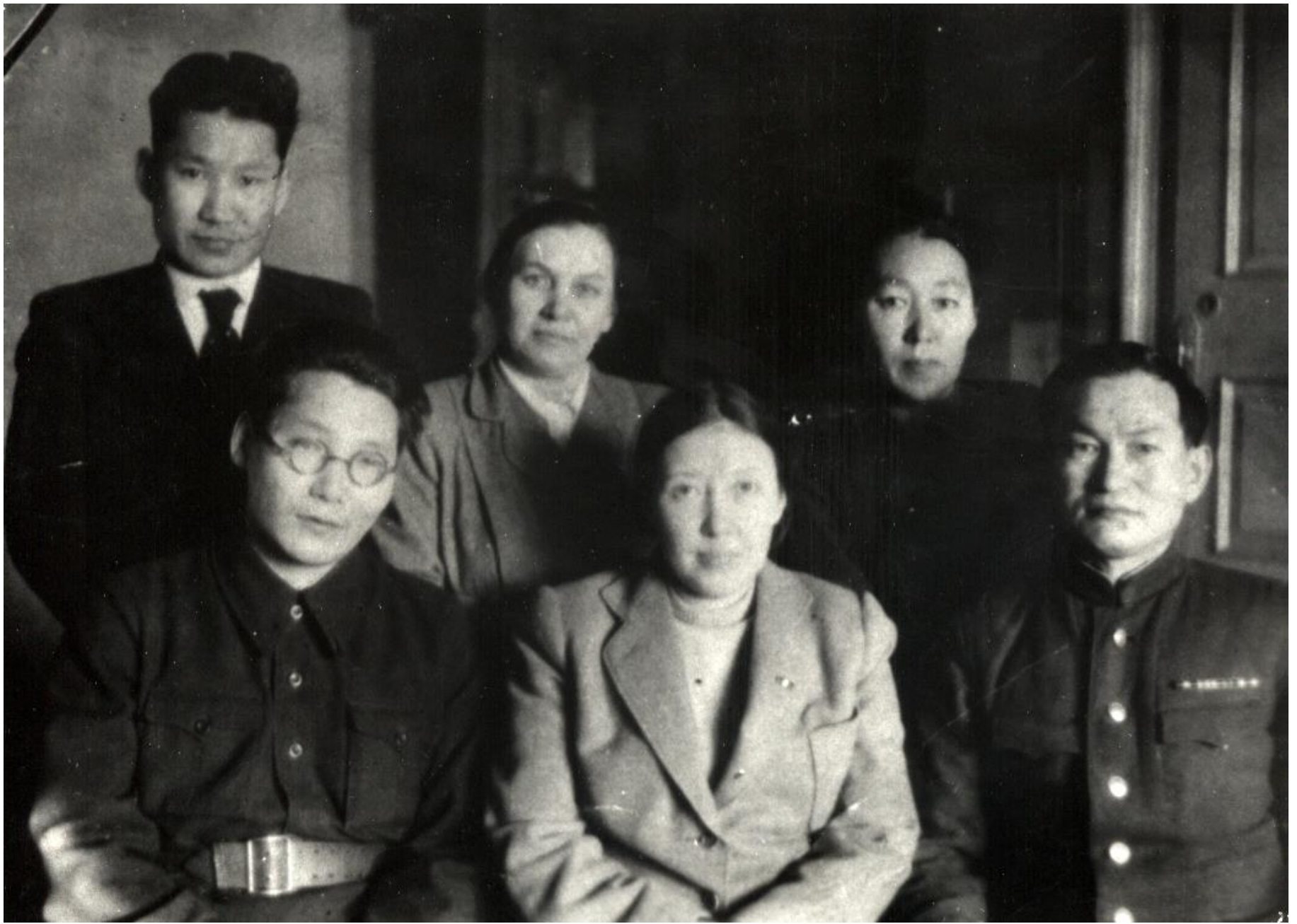
Историки ИЯЛИ. 1950 год.