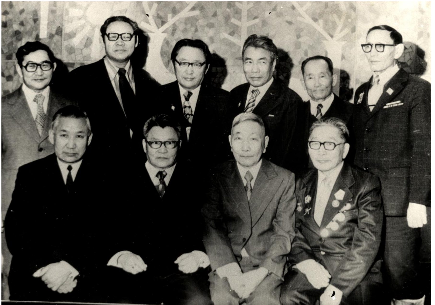
С учеными, писателями. 1980-е гг.