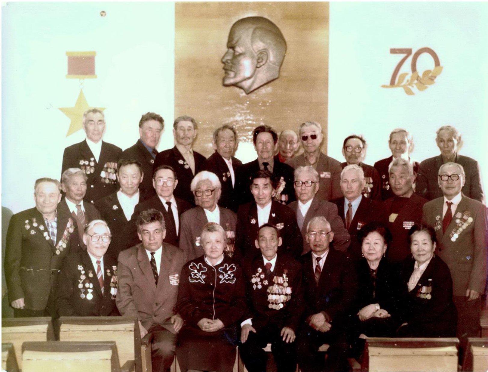
На юбилее Героя Советского Союза Н.С.Степанова.