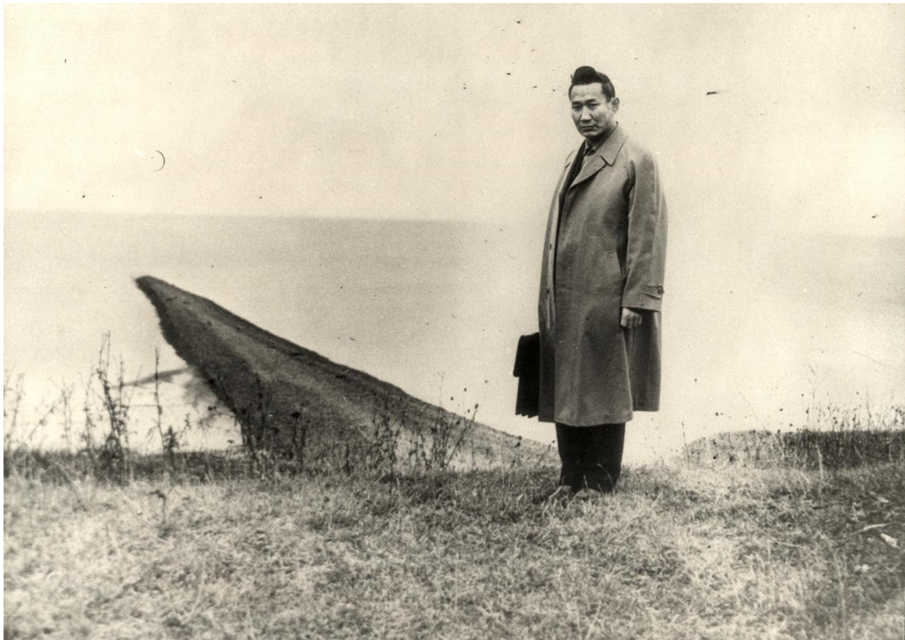
На озере Ильмень. 1960-е.