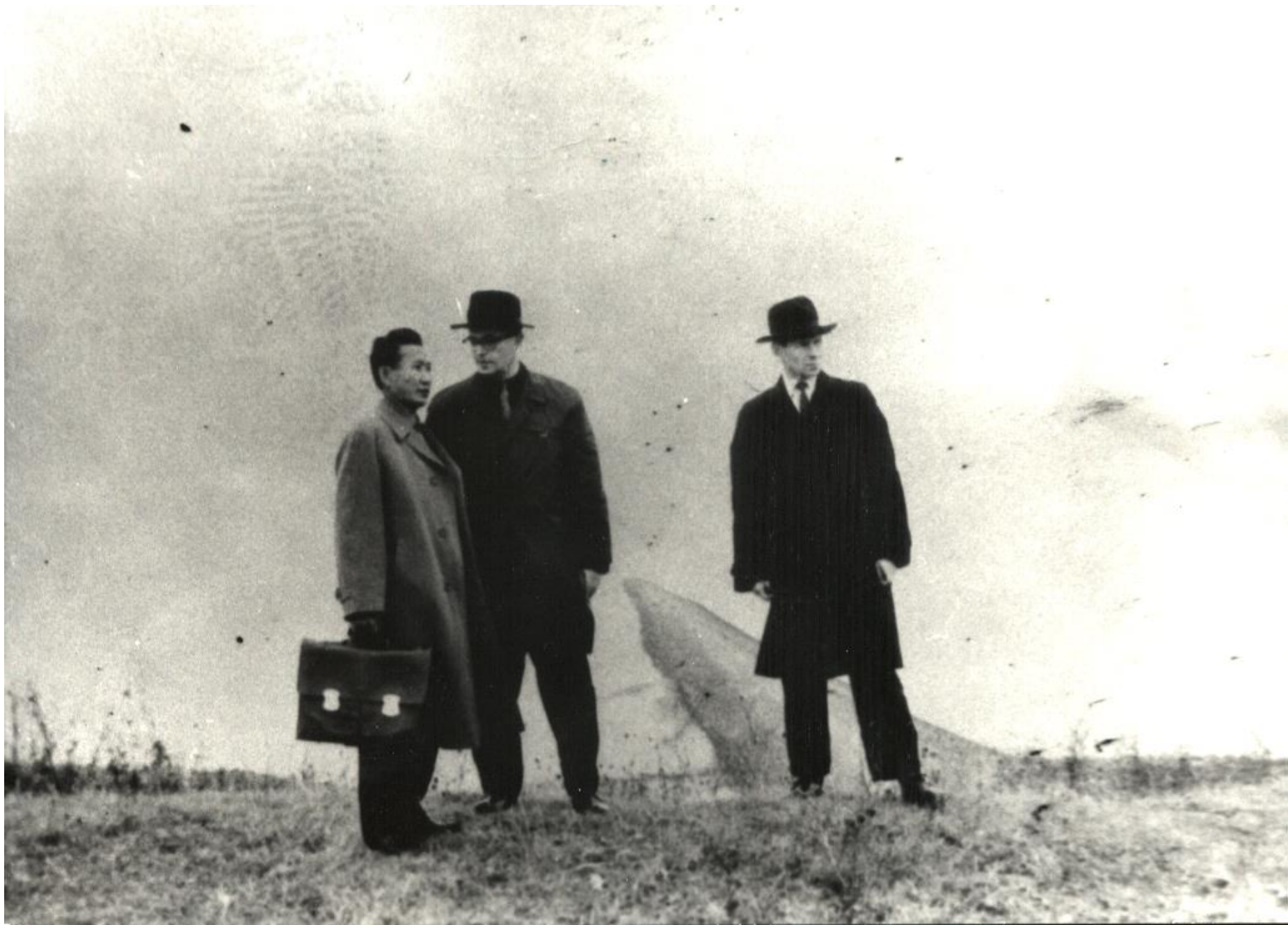
На озере Ильмень. 1960-е.