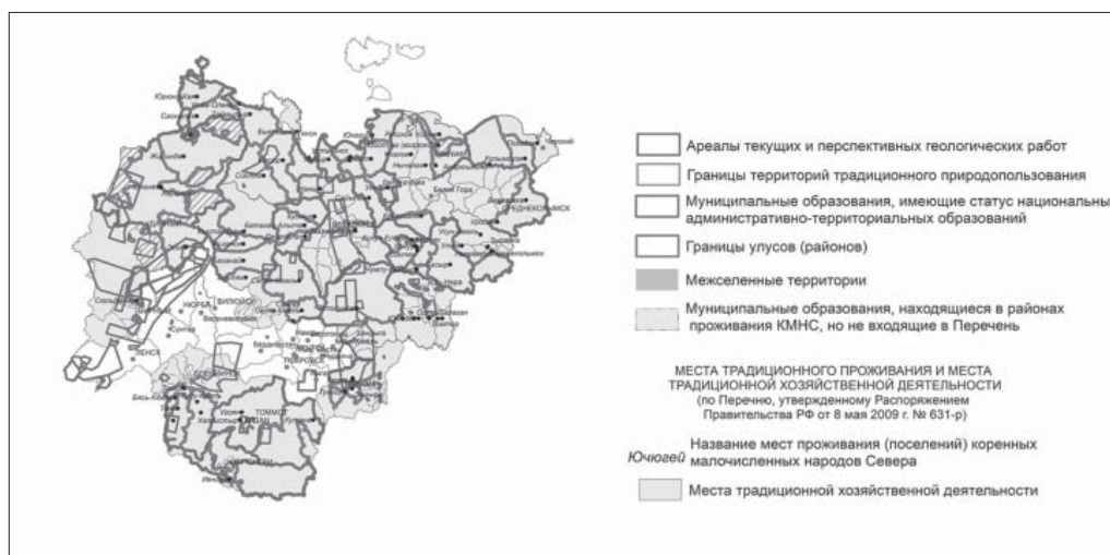
Рис. 2. Наложение тематических слоев в ArcGIS для группировки районов проживания малочисленных народов Севера по степени потенциальных конфликтов между интересами коренных малочисленных народов Севера и промышленными компаниями (составлен В.В. Филипповой, 2018 г.)

Для выявления ареалов соприкосновения интересов добывающих компаний и территорий традиционного проживания и традиционной хозяйственной деятельности коренных малочисленных народов Севера в Якутии в разработанную автором ГИС-карту был добавлен еще один тематический слой – ареалы текущих и перспективных геологических работ в районах проживания малочисленных народов. Источником данной информации послужил ГИС-атлас «Недра России», находящийся в открытом доступе [Недра России, 2018]. ГИС-атлас «Недра России» – это единая комплексная отраслевая геоинформационная система, интегрирующая сведения о геологическом строении и минерально-сырьевых ресурсах Российской Федерации, обеспечивающая Федеральное Агентство по недропользованию базовой геологической и геолого-экономической информацией, необходимой для принятия управленческих решений в сфере планирования, организации, контроля недропользования, воспроизводства минерально-сырьевой базы и геологического изучения территории России.